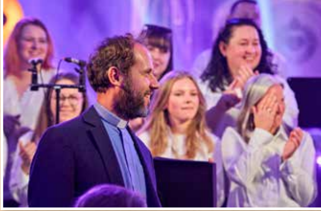
Jubileusz Sądeckiego Chóru Gospel