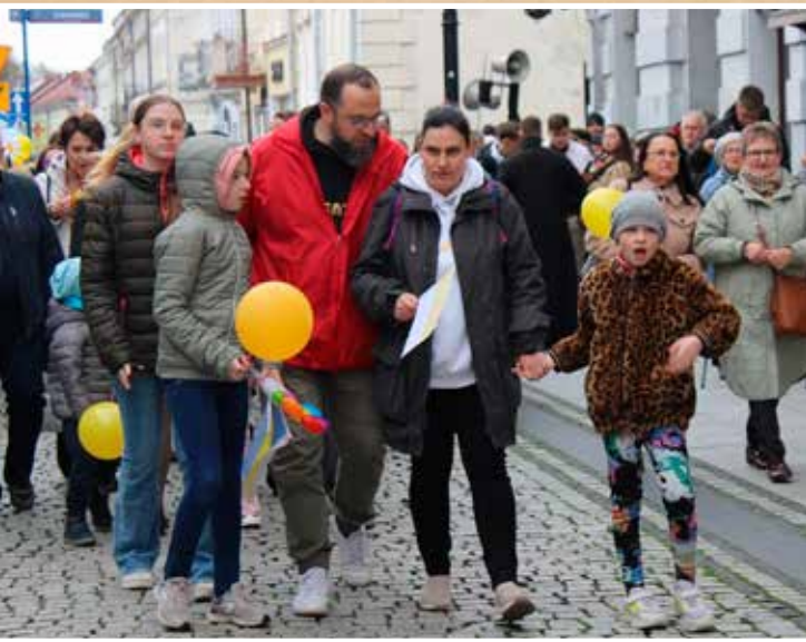
Marsz dla Życia i Rodziny